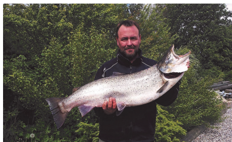
12,2 kg rendyrket sølv fra åen ...

Naturligvis er man ikke misundelig, for det er jo en grim følelse, der bør bekæmpes ... meeen, man forstår nu godt, at mange af vores hyttegæster kommer igen år efter år ;o)