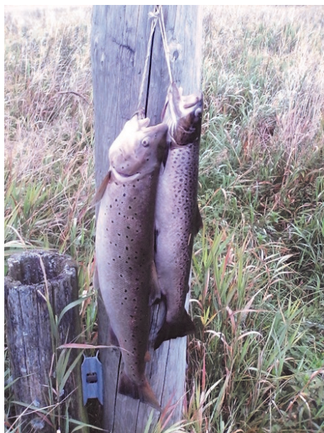
Fra en herlig formiddag ved Frydenlund