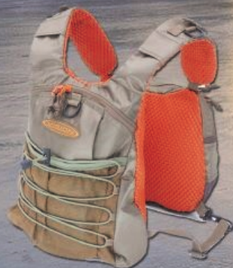
Vision Mycket Bra vest 699,-