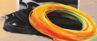
X-change WF-TriTip Tilbud 999,-