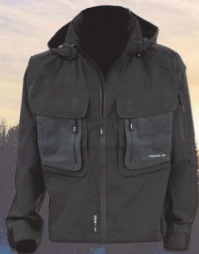
DAM Exquisite G2 Vadejakke Før 1999,- Nu 999,-