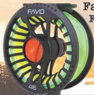
Favo hjul Fra 799,-