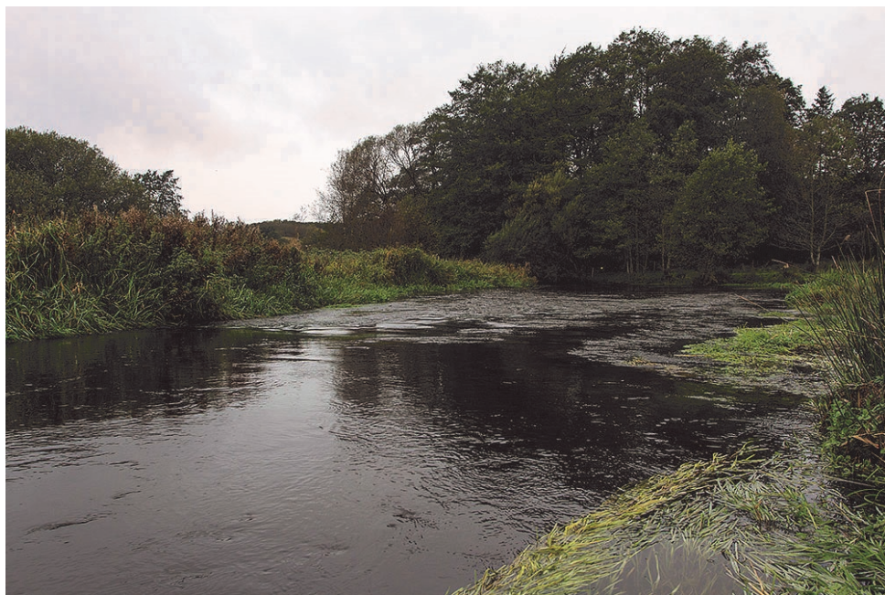
En af de nye gydebanker bliver anlagt lige opstrøms stryget i Skinderup. Som arbejdet ser ud i skrivende stund, skal det nok blive fint på længere sigt ...

Nederst på vores fiskevand, omkring Skindersbro, er der også ved at blive udlagt grus.