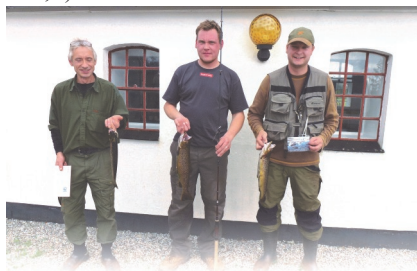
Sidste års vindere ...

Kom og få en hyggelig dag, og forhåbentlig nogle rigtig gode oplevelser ved åen ;o)