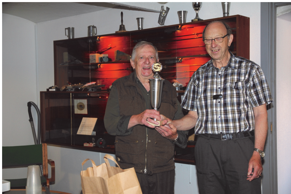
Samarbejds-pokal fra vores venner i Viborg Sportsfiskerforening